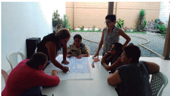
Mesa de diálogo comuna 15

El objetivo de estos espacios fue validar el diagnóstico de necesidades y prioridades en salud que se encontraron en el Plan de Desarrollo Local de la Comuna y Plan Decenal de Salud Pública de Colombia 2012-2021. Este ejercicio contó con la presencia de 44 asistentes, entre líderes comunales y personas de la comunidad, quienes en un espacio de sano debate expresaron las posibles soluciones a necesidades que ellos identificaron en su territorio.