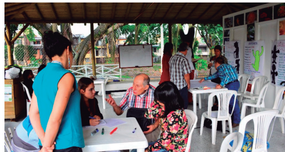
Habitantes de la Comuna 15 Guayabal en las Mesas de Diálogo del proyecto Gestión Territorial de Salud basado en la Comunidad